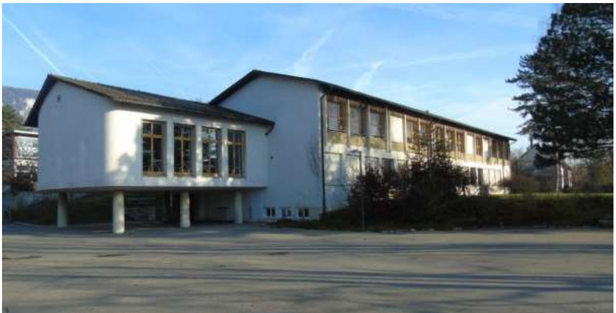
Abbildung 1: Ansicht Schulhaus B